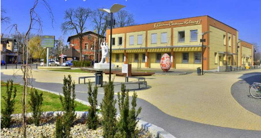
Gminne Centrum Kultury w Gogolinie.

Jednak za największy sukces minionego 5-lecia uważam fakt, że nie spoczęliśmy na laurach. Te wszystkie małe czy większe sukcesy, nagrody, wyróżnienia czy wysokie lokaty w rankingach tylko napędzają nas do dalszego działania – nie stanowią celu samego w sobie. Nie poprzestajemy na tym, co osiągnęliśmy dotychczas, z pokorą przyglądamy się dynamicznie zmieniającym się potrzebom i oczekiwaniom mieszkańców i inwestorów. Prawdziwy sukces tkwi nie w zdobywaniu wyróżnień, ale przede wszystkim w konsekwentnej pracy dla lepszej przyszłości.