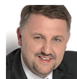
Jarosław Klimaszewski prezydent Bielska-Białej

Mijająca kadencja to ożywienie w gospodarce mieszkaniowej. Przy ul. Wapiennej do czerwca 2025 roku powstanie 205 nowych mieszkań komunalnych – inwestycja jest dofinansowana przez BGK. Niecały rok temu TBS oddał do użytku 30 mieszkań w nowym bloku. Wyremontowano aż 61 kamienic, a 28 prywatnych, często zabytkowych budynków, otrzymało dotacje na remonty. Suma wydatków na nieruchomości i gospodarkę miejską w tej kadencji to ponad 480 mln zł. Zlikwidowano ponad 6400 kopciuchów, czyli przestarzałych źródeł ogrzewania – to 60 procent wszystkich istniejących! Miasto bierze