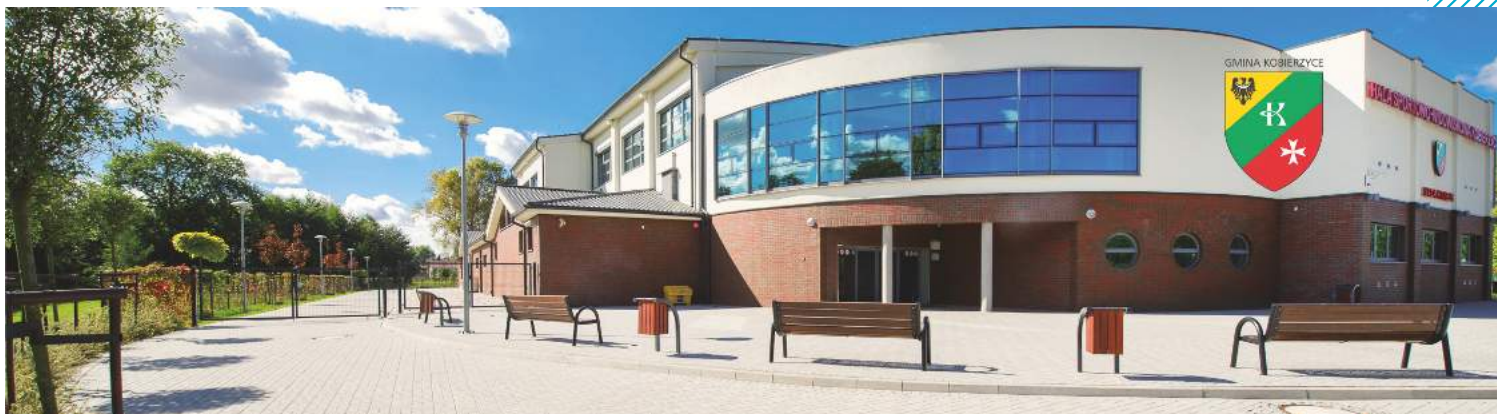
▲ Kobierzycki Ośrodek Sportu i Rekreacji. Gmina zajęła 1. miejsce w naszym zestawieniu.