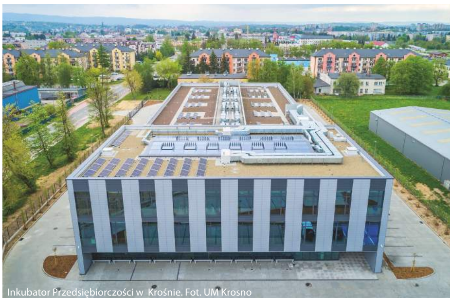
Inkubator Przedsiębiorczości w Krośnie.

Tworzymy warunki do rozwoju przedsiębiorczości, utrzymujemy wysoką jakość życia w mieście. Dbamy o kształcenie dzieci i młodzieży, staramy się sprostać oczekiwaniom osób dotyczącym mieszkań. Poszerzyliśmy granice miasta i uzbiliśmy nowe tereny (ponad 100 ha) dla inwestorów oraz wybudowaliśmy nowe połączenie drogowe z planowaną trasą ekspresową S19, która powinna być oknem na świat dla Krosna. Korzystamy z zewnętrznych środków pomocowych, bez których nasze ambitne plany nie byłyby możliwe.