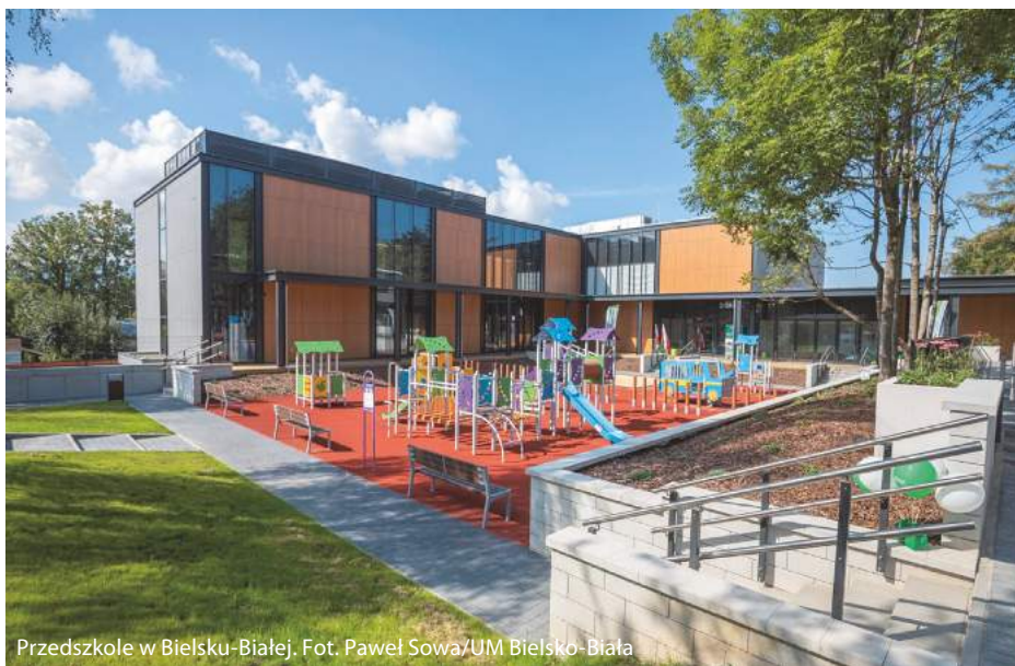
Przedszkole w Bielsku-Białej.

Sopot, Bielsko-Biała, Krosno i Tychy otwierają czołówkę zestawienia w kategorii miast na prawach powiatu. Jaka jest tajemnica sukcesu? Oddajemy głos prezydentom i urzędnikom z tych ośrodków.