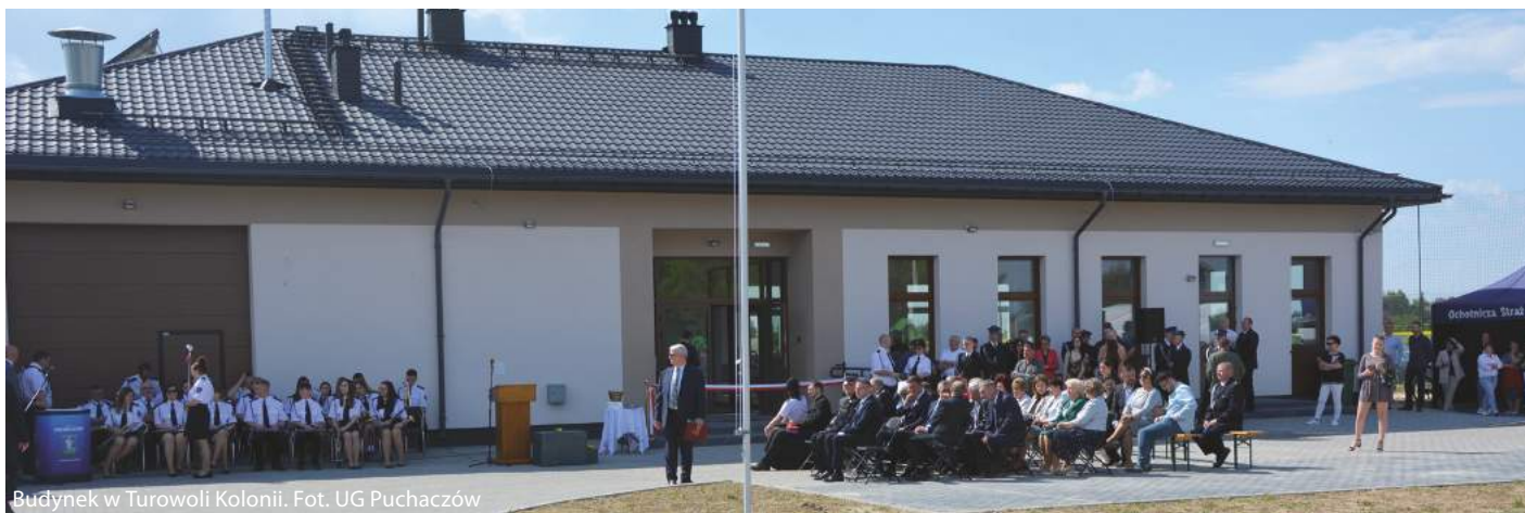
Budynek w Turowoli Kolonii.

W ciągu ostatnich pięciu lat na zakup i montaż ogniw fotowoltaicznych, pomp ciepła, kotłów ekologicznych przeznaczono w gminie ponad 1,1 mln zł, a wydatki na ochronę powietrza i klimatu pochłonęły ponad 10,3 mln zł, czyli 1805 zł w przeliczeniu na mieszkańca.