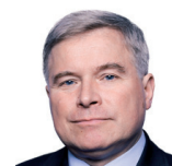
Piotr Przytocky prezydent Krosna

Ostatnia kadencja to realizacja inwestycji usprawniających działanie miasta, ale także zwiększających komfort życia. To m.in. dokończenie dużych przedsięwzięć związanych z infrastrukturą, mam na myśli np. przebudowę DK-44, jednej z głównych dróg w mieście. To był także czas wspierania aktywności obywatelskiej poprzez realizację budżetu obywatelskiego oraz programów społecznych i kulturalnych. I wreszcie szereg projektów związanych z aktywnością i rekreacją – rewitalizację parków miejskich, nowe nasadzenia, budowa stadionu lekkoatletycznego. Większość planów i złożonych tyszanom i tyszankom wyborczych obietnic, mimo pogarszającej się z każdym rokiem sytuacji finansowej samorządów, udało nam się zrealizować.