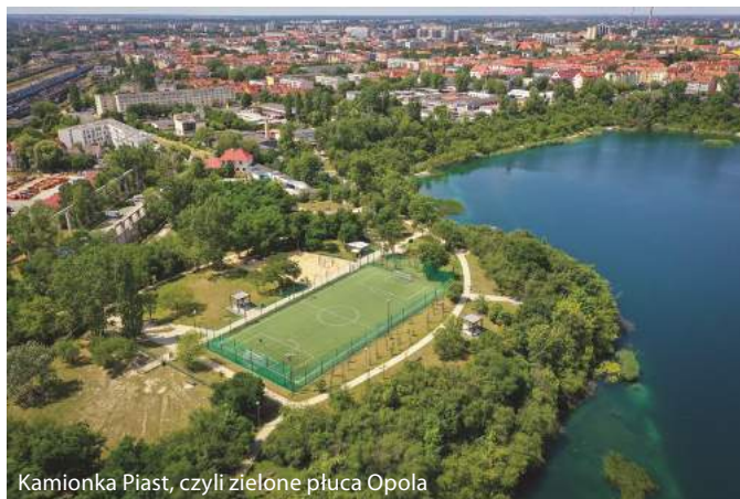
Kamionka Piast, czyli zielone płuca Opola

Zdecydowanie! Dlatego tworzymy przestrzeń do działalności różnych grup społecznych. Dzięki środkom europejskim organizacje pozarządowe oraz inne podmio-