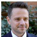
Rafał Trzaskowski prezydent Warszawy

W tym zestawieniu liczyło się bowiem to, czego mieszkańcy mogą samodzielnie doświadczyć na co dzień – nowe drogi i torowiska, inwestycje w komunikację publiczną, ochrona środowiska, opieka w żłobkach i mieszkania komunalne. Miasto konsekwentnie stawia na opiekę żłobkową. Tworzy warunki, które umożliwiają rodzicom i opiekunom łączenie życia zawodowego z rodzinnym. Liczba miejsc dla maluchów w placówkach publicznych i niepu-