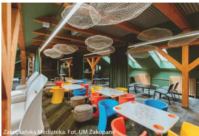
Zakopiańska Mediateka.