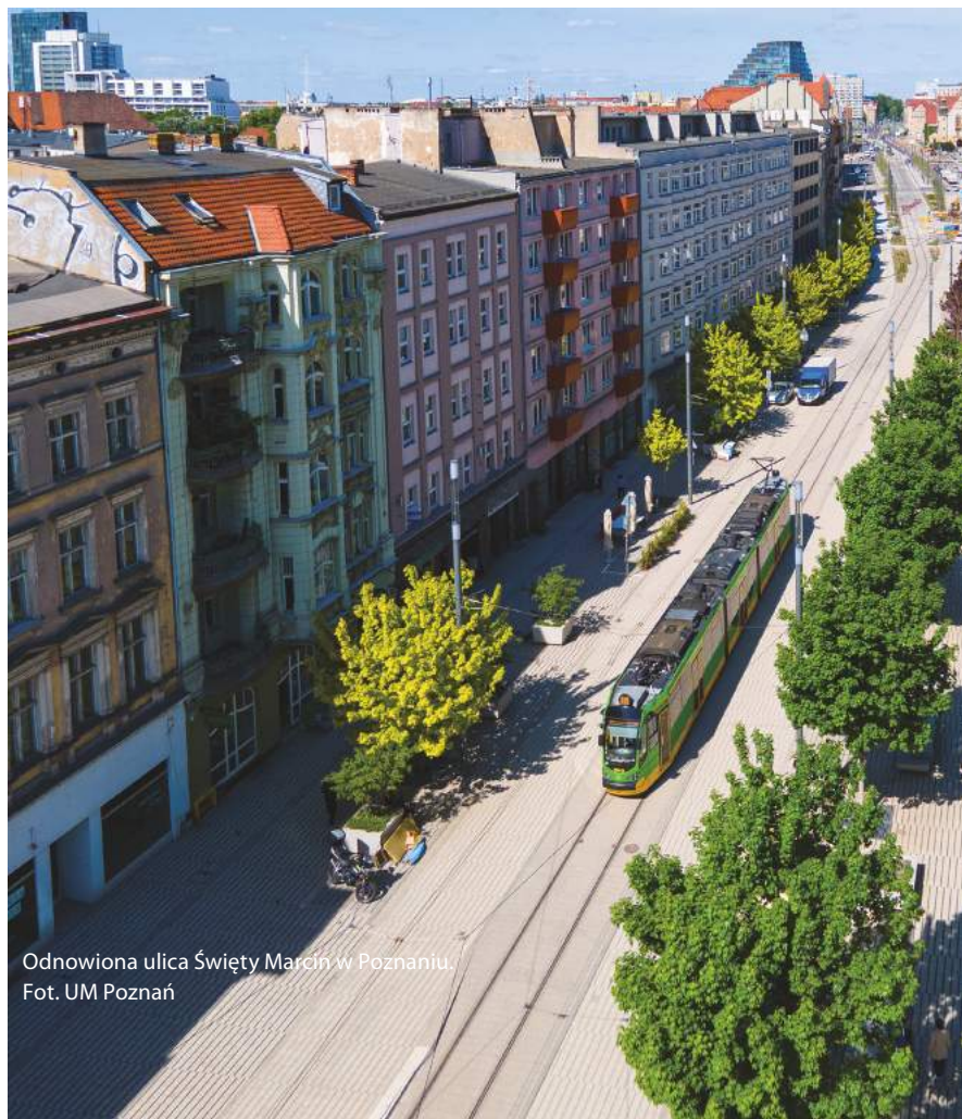
Odnowiona ulica Święty Marcin w Poznaniu.

Realizowane przez miasto cele Strategii #Warszawa2030 stawiają na wygodę mieszkańców, ich zdrowie oraz rozwój. Poprzez rozwój transportu publicznego chcemy nie tylko ułatwić codzienne poruszanie się, ale i dbać o czystsze powietrze. Inwestycje w zielen, w parki i miejsca aktywnego odpoczynku mają zachęcić mieszkańców do dbania o równowagę między pracą a czasem wolnym. Warszawa nie jest już i nie może być miastem kojarzonym wyłącznie z dużym rynkiem pracy i wyższymi zarobkami. Wzorem najlepszych stolic europejskich ma być przyjazna i atrakcyjna nie tylko dla młodych, ale i dla rodzin i osób starszych. Stawiamy na lokalność, która pozwala na budowę małych wspólnot. Ale nie zapominamy, że stolica to miasto talentów, ludzi ambitnych i pracowitych, którzy oczekują jakości życia, usług miejskich i oferty kulturalnej na najwyższym poziomie