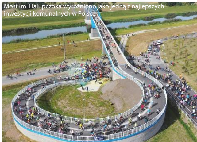
Most im. Halupczoka wyróżniono jako jedną z najlepszych inwestycji komunalnych w Polsce

Dodajmy, że w obiektowych i niezależnych od nas rankingach. Na szczególne wyróżnienie zasługuje m.in. rewitalizacja terenów wokół Kamionki Piast – niemal w sercu miasta. Projekt przyczynił się do rewitalizacji zdegradowanego i zanieczyszczonego terenu dawnej cementowni. Powstały m.in. nowe tereny zieleni, boisko sportowe i plac zabaw. Woda jest tak przejrzysta, że zjeżdżają tu nurkowie z całej Polski. Odpowiedzią