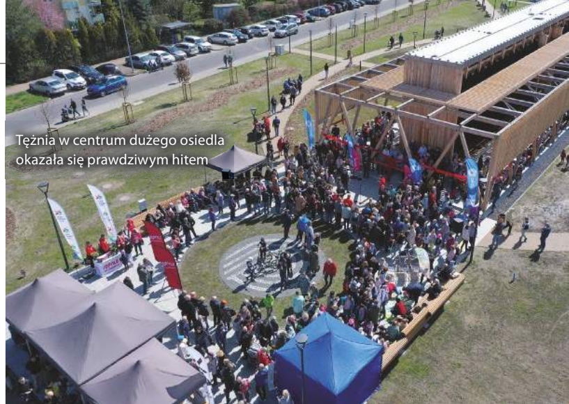
Tętnia w centrum dużego osiedla okazała się prawdziwym hitem

ty, którym idea dialogu oraz partycypacji społecznej jest szczególnie bliska, zyskały nowoczesne Centrum Dialogu Obywatelskiego. Powstało w stuletnim budynku. W kamienicy siedzibę ma dedykowana komórka Urzędu Miasta Opola do współpracy z organizacjami pozarządowymi, radami dzielnic i innymi instytucjami społecznymi. Kamienica stała się swoistym domem dla kilkunastu organizacji pozarządowych. Tuż obok, w miejscu wyeksploatowanego budynku, utworzyliśmy Centrum Aktywizacji Społecznej. To wielofunkcyjny