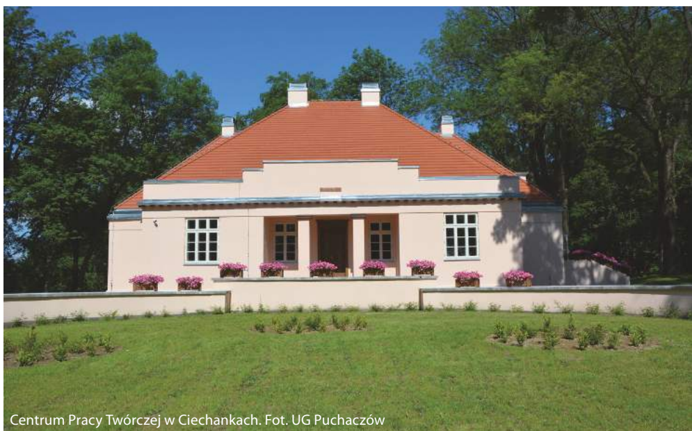
Centrum Pracy Twórczej w Ciechankach.

Z programu usuwania wyrobów zawierających azbest skorzystało od 2018 r. 219 osób.