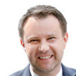
Arkadiusz Wiśniewski prezydent Opola

Na jakość życia mieszkańców Poznania wpływają m.in. działania na rzecz klimatu i środowiska naturalnego. Regularnie sadzimy nowe drzewa i rośliny – tylko w lasach komunalnych w ostatnich latach mamy na koncie 430 tys. nowych nasadzeń. Rosną wydatki na poprawę jakości powietrza. Od lat realizujemy program Kawka Bis. W tym roku, podobnie jak w ubiegłym, na dotacje do wymiany starych pieców przeznaczone zostanie aż 10 mln zł. O tym, jaka jest jakość powietrza każdego dnia, a także o ewentualnych zagrożeniach poznaniacy dowiadują się z tablic informacyjnych rozmieszczonych na przystankach komunikacji miejskiej. Strażników miejskich kontrolujących to, czym palą poznaniacy, w poprzednich latach wspierał specjalny dron. Dbamy również o to, by w mieście przybywało zieleni. Powstają parki i skwery, gdzie to tylko możliwe sadzone są drzewa i krzewy, stawiane są domki dla owadów miododajnych. Ważne jest także zagospodarowanie wód opadowych. Mieszkańcy mogą starać się o dofinansowanie na zbieranie i wykorzystywanie deszczówki, np. budowę przydomowych zbiorników retencyjnych.