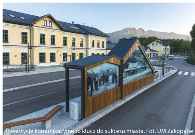
Inwestycje komunikacyjne to klucz do sukcesu miasta.

w tym trzy elektryczne i osiem spalinowych, spełniających normy Euro 6. Mamy pięć linii autobusowych komunikacji miejskiej utworzonej przez obecne władze miejskie.