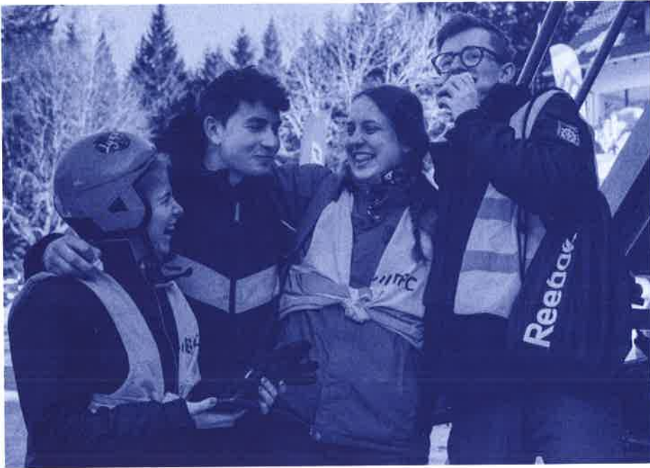
Ferie w Karpaczu