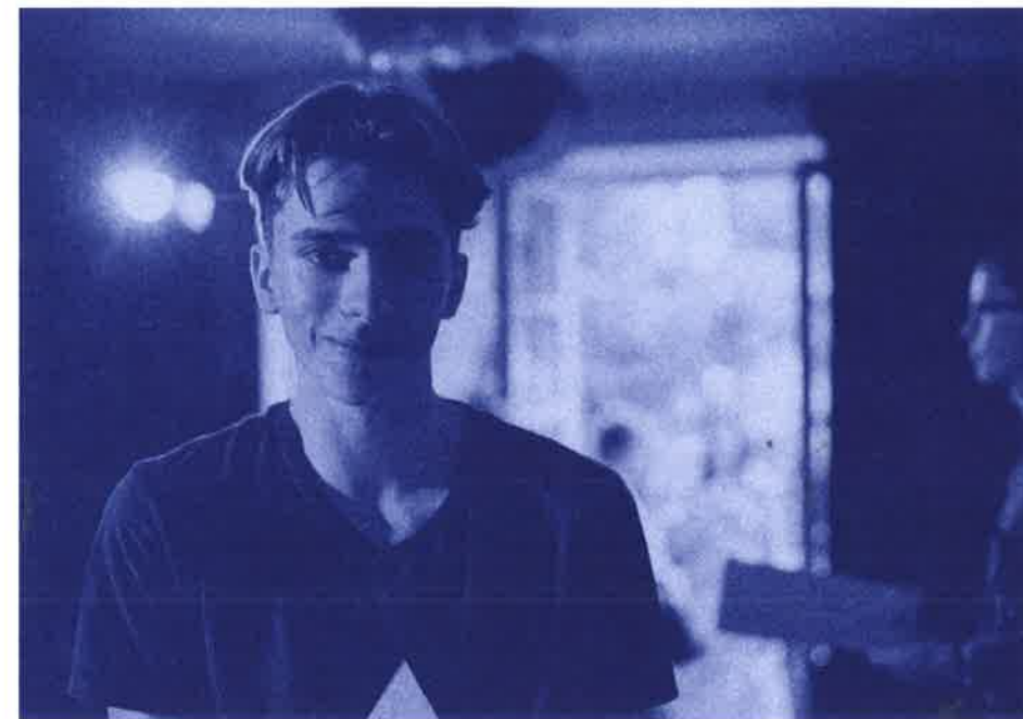
Impreza maturzystów, Warszawa

Do tej pory z Programu Stypendialnego Horyzonty skorzystało blisko 1000 uczniów i uczennic. Obecnie ponad 200 osób uczy się w 19 szkołach średnich w całej Polsce. Przy Fundacji EFC działa także stowarzyszenie Alumni EFC i FRS, które zrzesza absolwentów i pomaga nowym uczestnikom programu. Od 2016 roku Fundacja EFC prowadzi Horyzonty w partnerstwie strategicznym z Fundacją Rodziny Staraków.